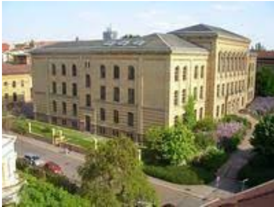
IGS.Halle Am Steintor, Adam-Kuckhoff-Str. 37