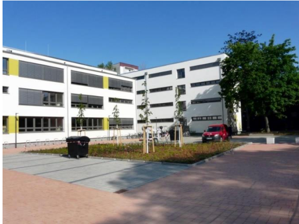
Gemeinschaftsschule Kastanienallee, Kastanienallee 8