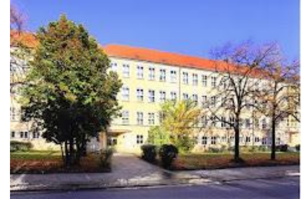
SeK Halle-Süd, Kurt-Wüsteneck-Straße 21