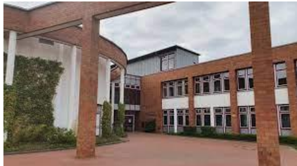
Elisabeth-Gymnasium, Murmansker Straße 14