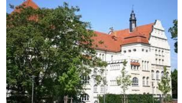
Giebichenstein-Gymnasium „Thomas Müntzer“, Friedenstraße 33