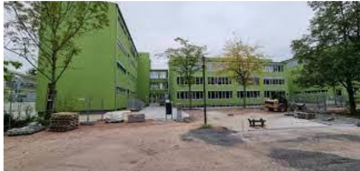
Gymnasium Südstadt, Kattowitzer Str. 40a