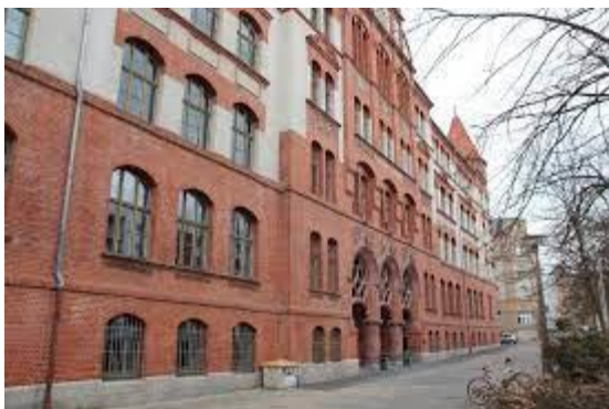
Lyonel-Feininger-Gymnasium, Gutjahrstraße 1