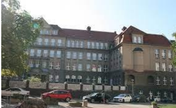
Hans-Dietrich-Genscher-Gymnasium, Friesenstraße 3