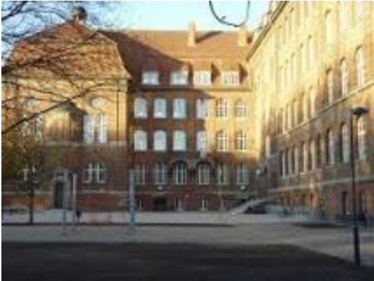
SeK „Johann Christian Reil“, E.-Schneller-Str. 1