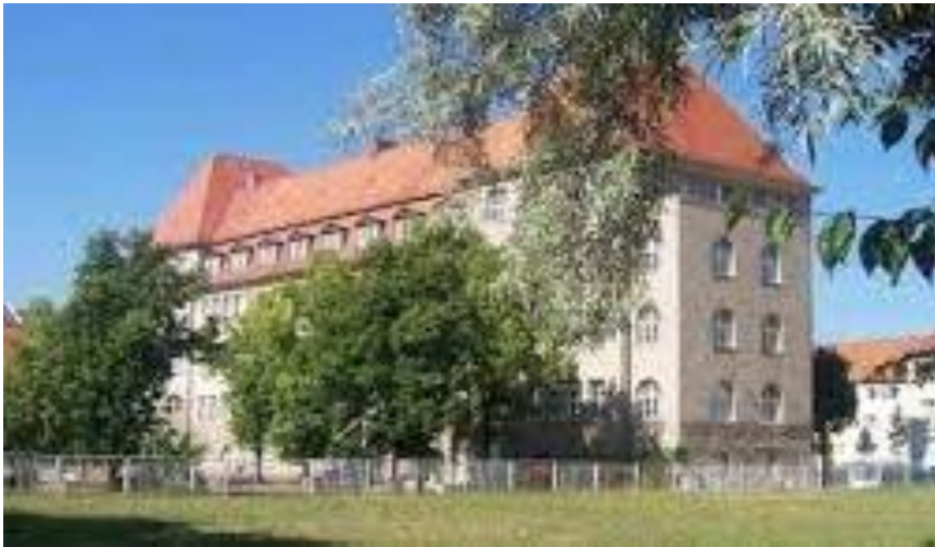
„Ulrich von Hutten“, Roßbachstr. 78