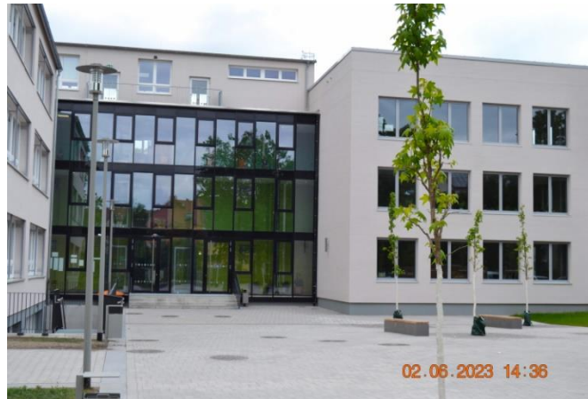
SeK Am Fliederweg, Budapester Straße 5