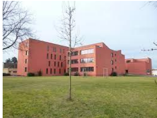
Sportschulen Halle (Sekundarschule und Gymnasium), Amselweg 4