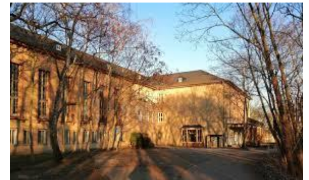
Freie Schule Bildungsmanufaktur, Hoher Weg 4