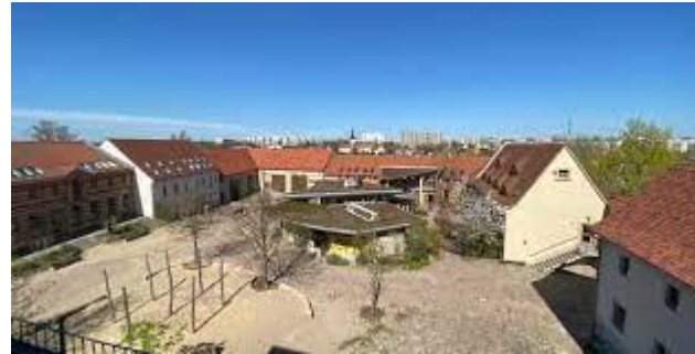
Freie Waldorfschule, Gutsstraße 4