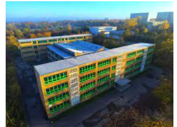
„Marguerite Friedlaender Gesamtschule“ (IGS), Ingolstädter Str. 33