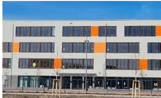
Integrierte Gesamtschule Am Planetarium, Holzplatz 4