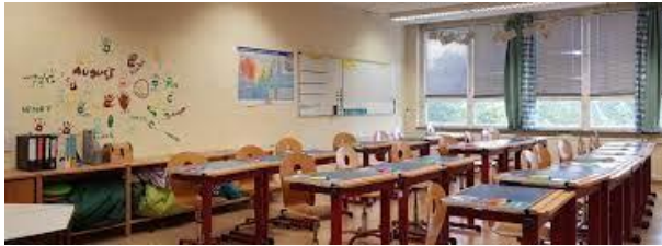
St. Mauritius-Sekundarschule, Jamboler Straße 1