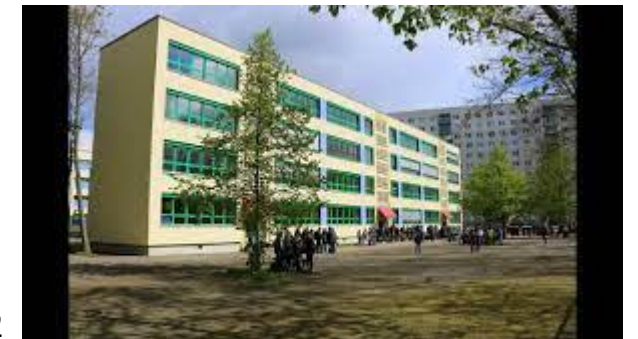
Christian-Wolff-Gymnasium, Kastanienallee 2