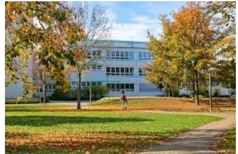
„Wilhelm von Humboldt“, Lilienstr. 19